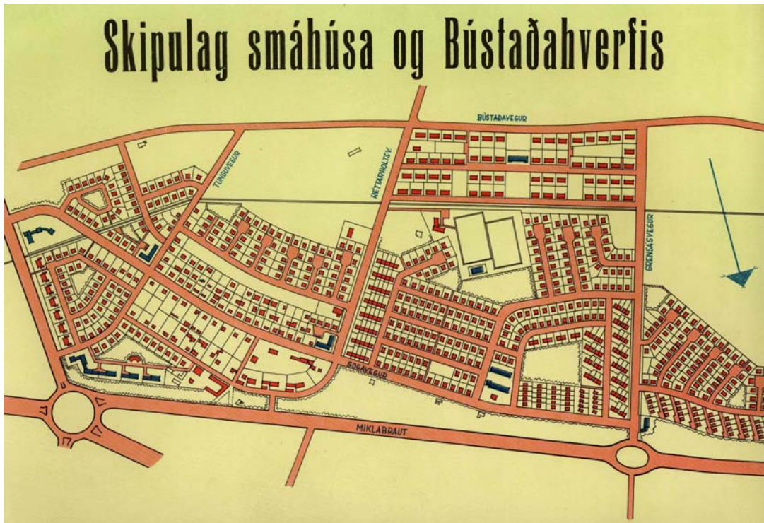
Fyrsta skipulag smáhúsa og Bústaðahverfis.

Fyrsta skipulagða úthverfið í Reykjavík reis í Kleppsholtinu um og upp úr 1942 og síðan í Langholti. Þetta var þá sjálfstæður bæjarhluti sem var töluvert utan við þáverandi byggð. Almennt er talið að staðsetning Kleppsspítalans hafi ráðið einhverju um þá ákvörðun. Hægt var að samnýta ýmsa þjónustu sem spítalinn naut, svo sem lagnir, samgöngur strætisvagna o. fl. Á næstu árum komu síðan í kjölfarið önnur hverfi austan byggðar, eins og Vogahverfið, Smáíbúðahverfið og Bústaðahverfið. 5